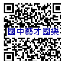
桃園市國民中學藝術才能國樂班 鑑定線上報名系統

(一)管道二(競賽表現優異入學)：113年3月29日(星期五)18:00前於前開網頁公告審查結果。